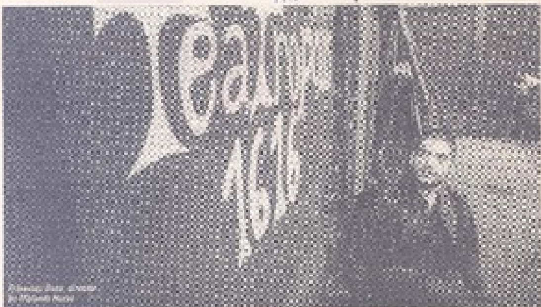
Matando Horas, montaje de Francisco Ossa. Foto: Fernando Álvarez