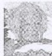
ISOLINA BARRAZA OFICINA

Nació el 3 de mayo de 1843 en la localidad de Condorcocha. Vivió en Hualqui del valle de Elqui. Fue una destacada escritora. Participó en el Premio Nobel de Literatura.