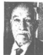
Tito Castillo Obrero Nacional de Américo

cerse con ella en su retiro en Duburg, Estados Unidos. El es capitán del vapor La Perla Negra y le busca en distintos puertos hasta que recala en Paíta. En un bar se encuentra con Juanita Alvarado quien resulta ser el mundo de Alejandra Cisneros. Al prepararse para abandonar la aldea que ella es una romera que seguramente se ha vido a vivir a Lima. El capitán Edlano se embarca y ordena a la tripulación, rumbo a Lima. "El verano del maricón" es sólo un pretexto para describir el golpe militar que interrumpió la democracia chilena y que significó el exilio del protagonista hasta que después de varios años regrese a Chile a casa de su tío taxista después de haber sido agricultor. Cuando joven se había enamorado de una muchacha en Europa. El tío lo frustra cuando el padre de ella se trasladó a otra ciudad. Él la persigue en su moto, pero la pierde de vista y a su regreso a nuestro país la sigue afirmando no obstante