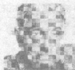
YO, EL ESCRITOR

Actualmente el escritor se encuentra en el Sanatorio Santa Clara, de Asunción. Roa Bastos vivió años de exilio en Argentina, Francia y España, durante la dictadura de Alfredo Stroessner (1954-1989).