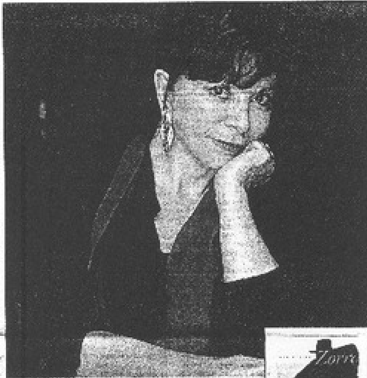
Isabel Allende en un momento de la obra.

El libro cuenta el periodo de la independencia de Chile, un momento crucial para el país que se vive en un momento de la historia que se vive en un momento de la historia.