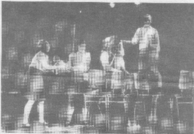
Los actores de esta tragicomedia son egresados de la Academia de Teatro Fernando González. Hace dos años formaron la compañía La Cualquiera.

Ellos son egresados de la Academia de Teatro de Fernando González de Santiago y miembros de la compañía La Cualquiera que tiene sólo dos años de trayectoria. Su