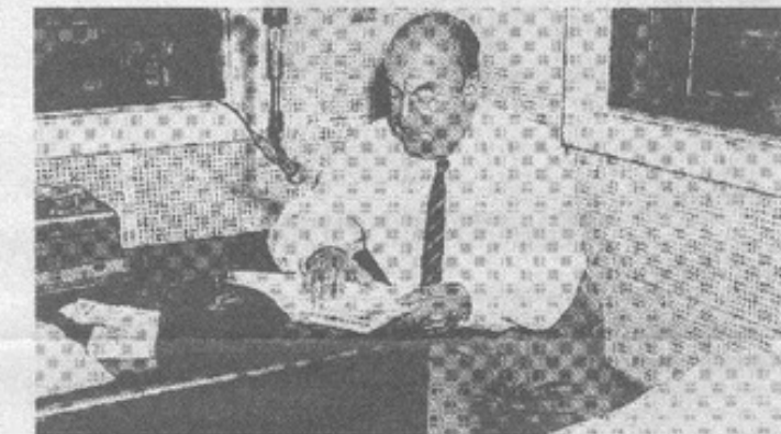
No hay en las casas de Neruda ampulosas sillas isabelinas ni de estilo "Luis tantos", sino buenos recostadores de varqueta, cueros rústicos pero confortables, indicados para el cansancio del impenitente viajero.

Por cierto, ya es hora de decir que la hospitalidad es una de las virtudes más reconocidas