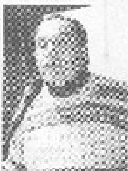
El Poema 20, Walking Around, Ode al Mar y el Poema 12 de Las Albas de Machupicchu fueron declamados por el poeta chileno en un recital. Walter Pineda.