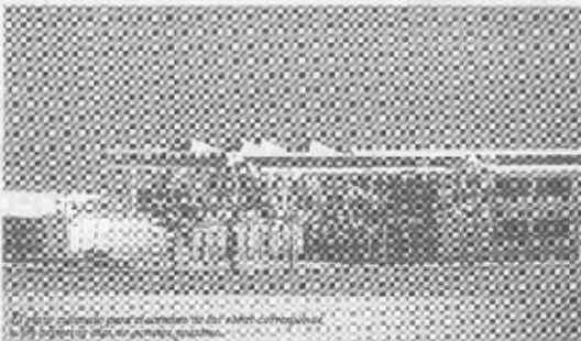
El paseo contempla para el acceso de los niños culturalistas, los paneles de acero inoxidable perforado.