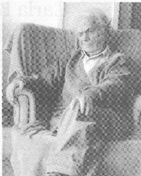
REY & MENDIGO, su poema sobre la Universidad Diego Portales, en el caso de Poemas & Antipoemas, antecipo del homenaje del sábado.