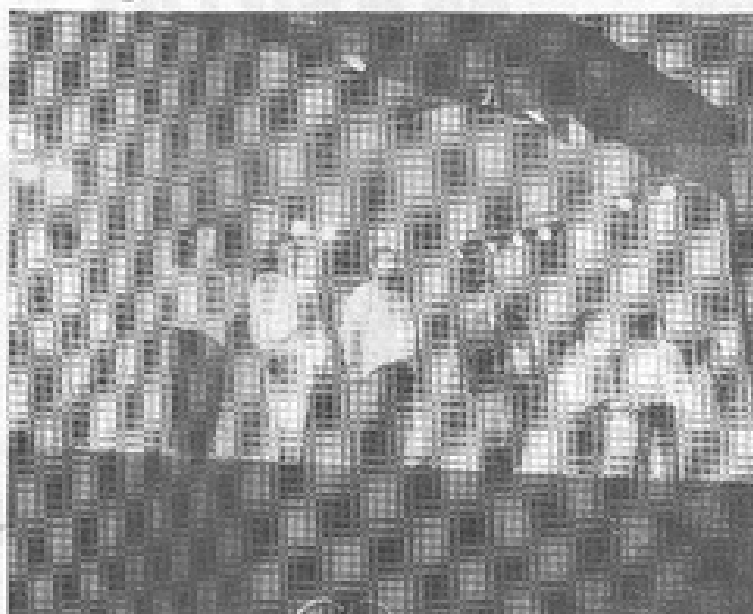
La compañía de teatro fue aplaudida de pie por los presentes.

Un éxito fue la presentación de esta obra en el Teatro Municipal de Calama, la que fue ovacionada de pie por el público presente