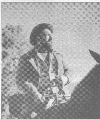
Pablo Neruda está de regreso en las pantallas. Esta vez, en un documental que se ha realizado en homenaje a los cien años de su natalicio.