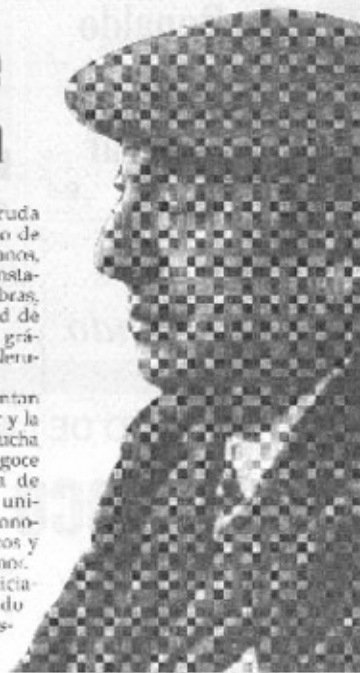
La figura de Neruda se ha exaltado en su centenario.

Participaron en la iniciativa desde el consagrado Vicente Rojo hasta artistas recién egresados de la Escuela Nacional de Artes Plásticas, de México.