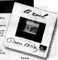
Portada de la reedición de la obra "Azul" de Rubén Darío.

mejor: el preludio de la nueva poesía. "Fue la primera aventura por los avances tecnológicos de la comunicación apoyada por la tecnología digital. En el retículo y expresión de un mundo que cambia el rostro por el rostro". "Las nuevas generaciones postmodernas crean nuevas utopías posibles y alternativas. Esto debería suceder".