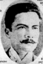
Rubén Darío en la época en que escribió "Azul".

Valparaíso lo recibirá en este lugar editado con los versos más importantes, "Azul" en junio de 1988.