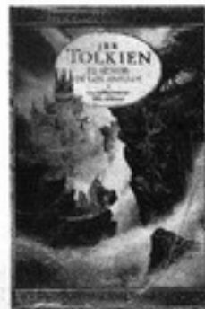
TOLKIEN sospechaba que Lewis había tomado ideas de su saga El Señor de los Anillos .