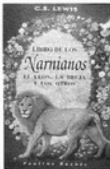
CHICAS DE NARNIA, de Lewis, le permitió introducir a Tolkien.

Tolkien invitó a Lewis al club Los Cuadrados, creado por él en Oxford y cuyo objetivo era leer algún manuscrito en su idioma original (previamente de haber converso) y escapar de la tediosa actividad académica. El grupo se disgregó y ambos entraron a participar en otros. Los Inklings, que funcionó durante 30 años,