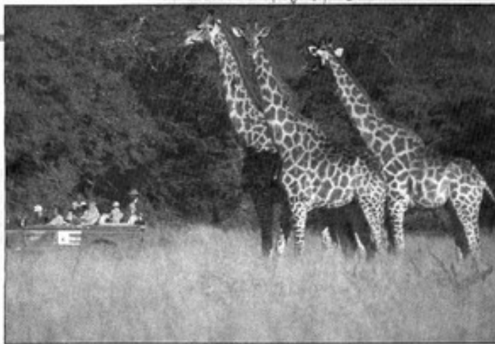
Safari africano: viaje al corazón de la guerra civil de Mozambique

ducho de una ambición y crueldad sin límites. Es un ex guerrillero marxista que abandona sus ideas políticas para mudarse al bando rival, donde se apodera del poder sin dejar sus tácticas de lucha, su maldad y sus deseos de venganza.