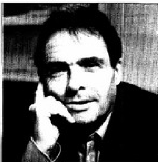
POLITICAMENTE RADICAL. Por su último ensayo del mismo Cordeiro destaca con el propósito de la Legenda Urbana

Con su último ensayo, Pierre Bourdieu confirma su reputación como padre de la sociología contemporánea.