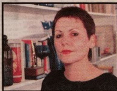
DIAMELA ELTIT, SU ACTUAL MUJER. -¿Está de acuerdo con Enrique Lafourcade en que una mujer debe ser joven e inteligente para que le guste? -Yo creo que son innecesarias e infinitas las razones por las cuales un ser humano puede sentirse atraído a otro. Y eso vale para mujeres y para hombres. -Es extraño que las dos que se le conocen sean inteligentes y jóvenes... -No quiero hablar de mi vida privada. Agradezco sus expresiones sobre la inteligencia. Sobre la juventud, tendrías usted que chequear el certificado de nacimiento.

"Creo que logró superar el lenguaje político, donde todo es dramático, histérico, crítico, grandioso, declamatorio. El maximalismo en el lenguaje político es feo".