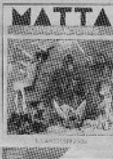
Un libro inusual en nuestro medio.

Matta niega reiteradamente que lo que hace sea pintura y que él sea pintor, tal como estos conceptos se entienden habitualmente.