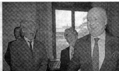
CARCAJADA Nicanor Parra se ríe de un "artefacto" que le "lanzò" a Jorge Edwards.

● Las obras de Edwards han sido traducidas al francés, inglés, italiano y portugués