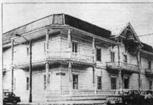
"La madera es cálida y se emplea en todos los estratos. Es un material vivo, que al usarlo en construcción actúa como un succion, que puede sufrir fácilmente transformaciones". Palacio Astoreca. Monumento Nacional.