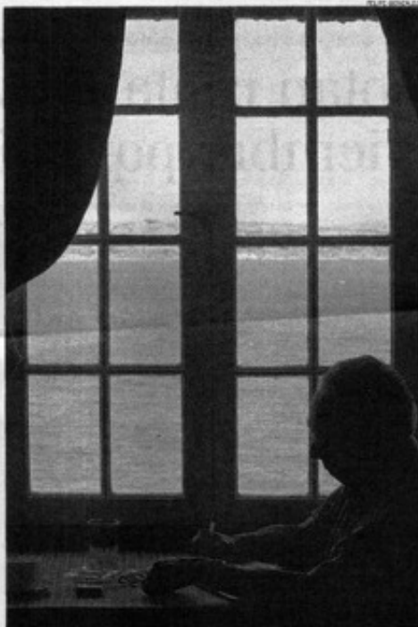
LA CASA DE PABLO NERUDA en Isla Negra o La Sebastiana en Valparaíso, son algunos de los destinos obligados para quienes realizan los tours de las agencias afiliadas al programa Litoral de los Poetas.