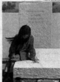
LA TUMBA de Vicente Huidobro en Cartagena también se visita en el circuito.