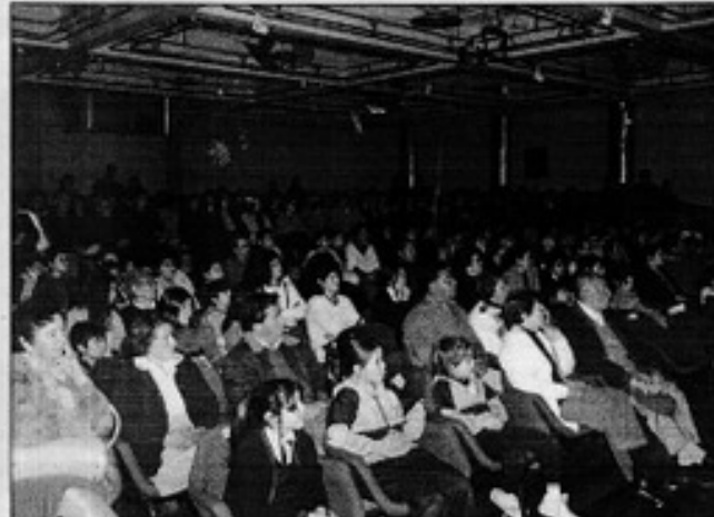
Un público cada vez más numeroso se dirige a la obra en el municipal de San Felipe. La imagen que surge por el solo momento el grado de adherencia que la comedia suscita tiene por las experiencias artísticas - culturales.