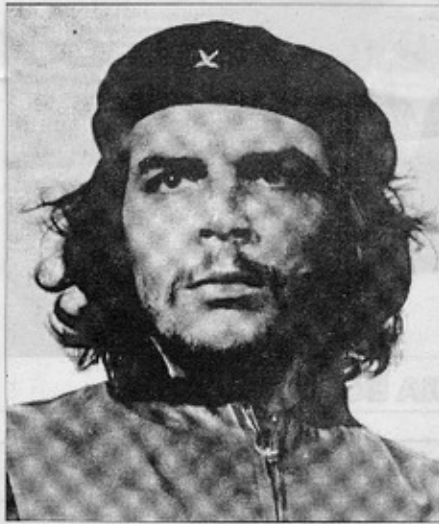
"Guerrillero heroico" es la imagen del 'Che' Guevara que hizo famoso intencionalmente a Korda.

Korda se compromete con todo un proceso social, puesto que la fotografía no es solamente una forma de ganarse la vida, sino que es un medio mucho más contundente para expresar ideas. El trabajo de Korda debe ser admirado, sobretodo por las nuevas generaciones, ya que va más allá de lo desechable. Es una fotografía que ha permanecido en el tiempo.