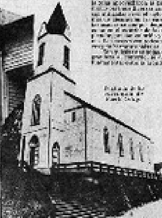
Figura No. 4