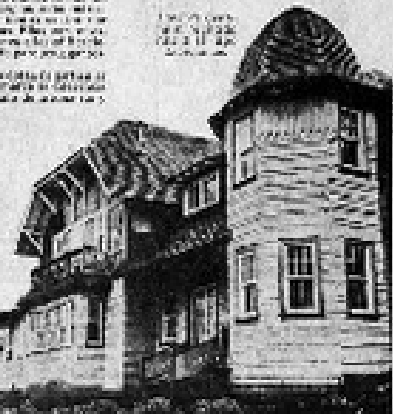
Figura No. 5