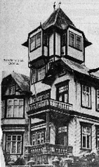
Figura No. 3

El presente estudio de la arquitectura en madera en la Provincia de Osorno, Chile, es el resultado de un trabajo de investigación que se realizó durante el año 1927, con el objeto de conocer el estado actual de la arquitectura en madera en esta provincia, y de determinar los tipos de arquitectura que se han desarrollado en ella, así como también de estudiar los factores que han influido en su desarrollo.