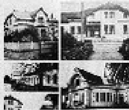
Entre otros, en esta ciudad, DOWNTOWN, el autor ha estado en contacto con los habitantes que se han quedado en la ciudad, a pesar de la gran cantidad de edificios que se han destruido. En la parte superior izquierda, una casa de estilo victoriano; en la parte superior derecha, una casa de estilo colonial; en la parte inferior izquierda, una casa de estilo neoclásico; en la parte inferior derecha, una casa de estilo art déco.

TEXAS. Desde Chicago REPRODUCCIONES. Héctor Malbranco