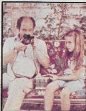
Con su última mujer: su hija.

En su oficina, la mujer es fuente permanente de inspiración; en la vida tangible son su mujer y su hija; además están las que asenan a las talleres literarios, y las que van a escucharlo a