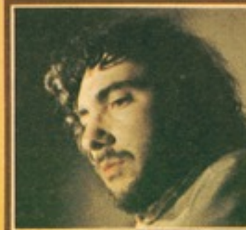
Marcelo Maturana: un mundo de juego en sus cun- tos.