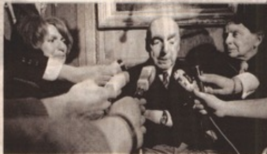
NOBEL. NERUDA Y URRUTIA, EN PARÍS, CUANDO EL ESCRITOR RECIBIÓ EL PREMIO NOBEL EN 1971.

Los años pasaron, y en 1992, los Mántaras ya enfermo viajó a Santiago para dejar en manos de Insunza el herbario, que según instrucciones de Neruda debía ser editado como un facsimil. Luego, siguió un vertiginoso intríngulis editorial. "La Fundación Neruda decía que esos versos ya estaban en las Odas Elementales y tres editoriales no tuvieron en sus manos y terminaron desechándolo", explica Insunza. "Llegaron a decirme que iban a surgir complejidades para obtener financiamiento, pero en el fondo el problema era que se celebrara este amor clandestino", insiste. Esta semana, la Fundación Neruda