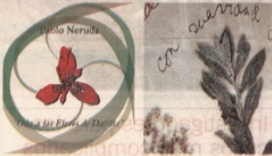
NOVEDAD. TAPA Y UNA PÁGINA DE "ODA A LAS FLORES DE DATITLA". SE EDITA EN NOVIEMBRE.

anunció en Santiago el lanzamiento de las Obras Completas a través de Hernán Loyola. Se trata de cuatro tomos minuciosos en los que, sin embargo, no se contempló la edición de este herbario.