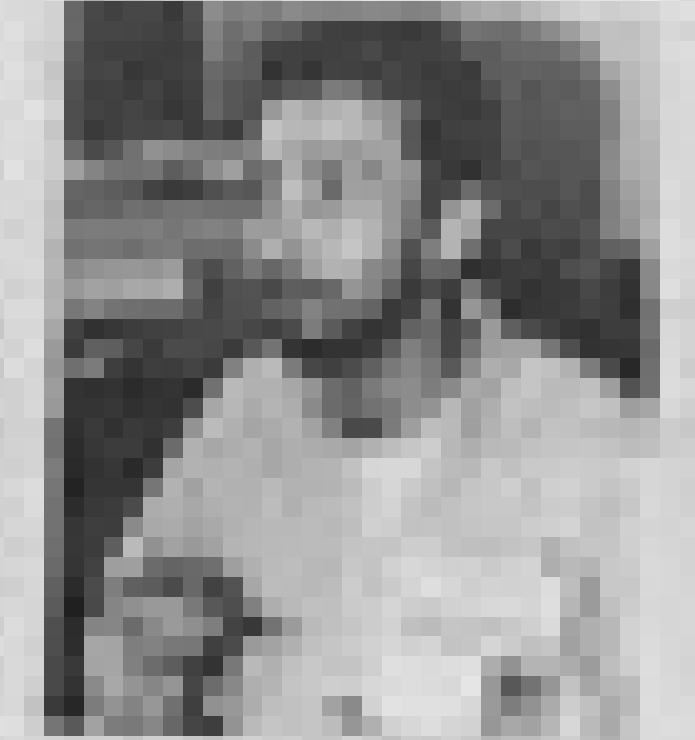
Figure 2: A photograph of a person sitting at a desk, looking at a computer monitor.