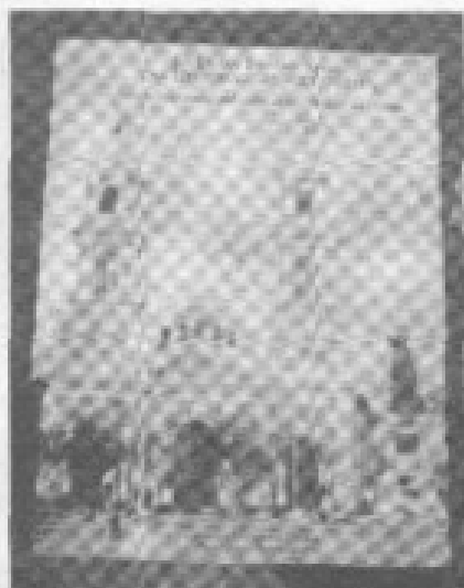
La portada del libro "La plaza fundacional: una historia para ser contada".

Por Patricio Rodríguez