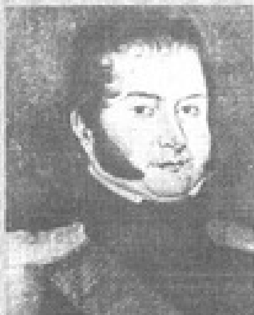
Un O'Higgins diferente, en la obra recién publicada del profesor Julio Marchese.