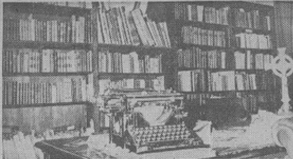
La máquina de escribir en primer plano y parte de los dos mil setecientos libros de la biblioteca de don Diego Dublé Urrutia.