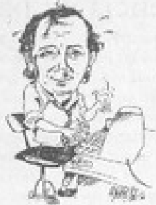
Por Jorge Abasolo Aravena

Título: Nerudario. Autor: José Miguel Varas Editorial: Planeta. 248 páginas.