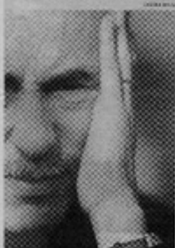
Hugo Achugar se sintió fascinado por la ambigüedad del personaje.

Brum es la inspiración del libro Falsas Memorias , del escritor uruguayo Hugo Achugar, suerte de biografía novelada publicada por Lom. Pero tampoco es completamente ella. Así lo revela una carta llegada al Centro Cultural de España, dos años de la presentación de la obra, donde una supuesta Blanca Luz Brum solicitaba desde la tumba detener el lanzamiento. La misma no se dio a conocer.