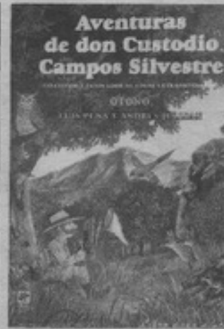
El explorador trabaja por las cuatro estaciones mirando todo con los ojos muy abiertos.