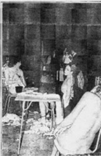
Casi al final de la acción, los actores están desnudos. Hay basura, comida y sangre. El público está dividido y grita.