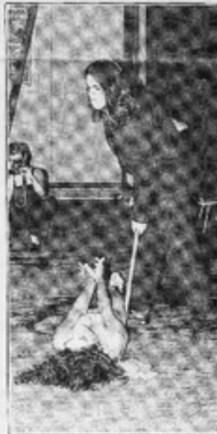
Una mujer es arrojada y golpeada durante mucho rato.