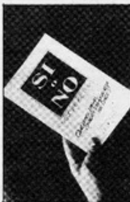
La portada del libro.

gente, ya que en 1980 la opción era retornar a la situación de 1973.