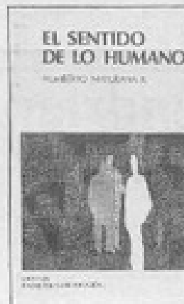
"El sentido de lo humano" de Humberto Maturana.