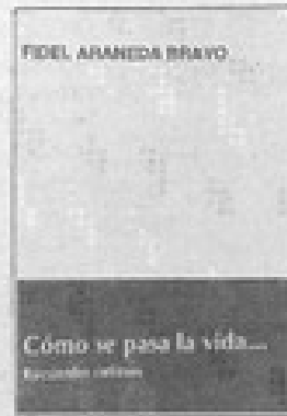
"Cómo se pasa la vida... Recuerdos íntimos" de Fidel Aranedo.