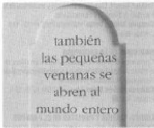
Una página de Nosotros , de M. Tics (Pehuén).

Esto oda a las especies marinas que el maremoto dejó al descubierto en la playa es, a la vez, una oda al mar con sus turras y a este país, azotado por ellas. Las xilografías de la artista suiza Carin Olfert, que sirvieron de inspiración al poeta, acompañan sus versos. (MP Ester Donost) ■