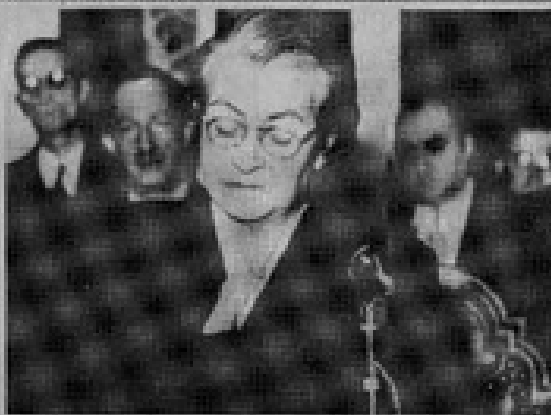
Gabriela Mistral cuando agradece el Premio Nobel de Literatura que le fue otorgado en 1945.

En cambio, pronto se inclina ante Cristo y su Evangelio. El arte mismo es un oficio divino que se sostiene sobre una de las bases fundamentales del organismo, la memoria. "Te cantará cuenta Gabriela las palabras de