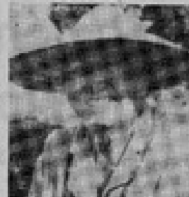
"Tala es mi verdadera obra..."

La eternidad que tiene conceptualmente en Desolación como algo extraño e incomprensible, en Tala se voladere en un estado de ser como un estado de ser. "Acordarse del frío tiempo en que los días tenían y de él venían aligados". Dios continúa presente en su como voladere, consuela e invita esperanza. Dios Dios recibirá el fruto de los corazones negros. La América compaña en carnes, ofreciendo desde las alturas su cuerpo su ofrenda, que es la ofrenda de los niños, mayor y atroz. Tal vez el hecho tiene a la Conchita tiene su origen en su patria chilena. El que, en