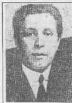
Retrato del poeta Max Jara. Premio Nacional de Literatura, cuyos restos fueron trasladados desde Santiago a Yervas Buenas.

Ayer se efectuó un oficio fúnebre en el templo parroquial de Yervas Buenas y después se procedió a su sepultura definitiva en una cripta especial construida en la Plaza de la Recova, frente al Museo de Yervas Buenas.