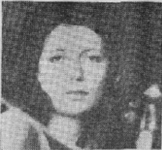
Entre los solistas instrumentales de esta temporada participará la violinista yugoslava, Marina Vukcevic.