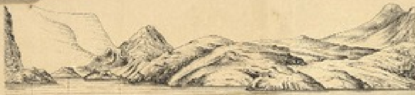
Costa de Chiloe... Estrecho de Caleta Rayo

«Navegante de Isla Inacende a Guis. Viñeros»