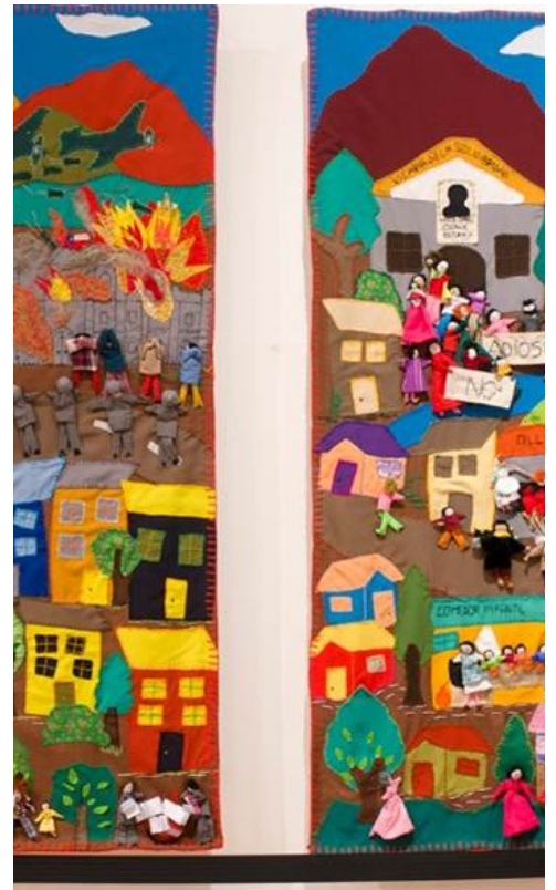
Arpilleristas de la Región Metro...