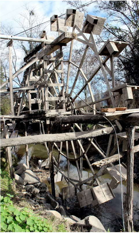
Modo de vida campesino de Larm Tradición oral Rapanui