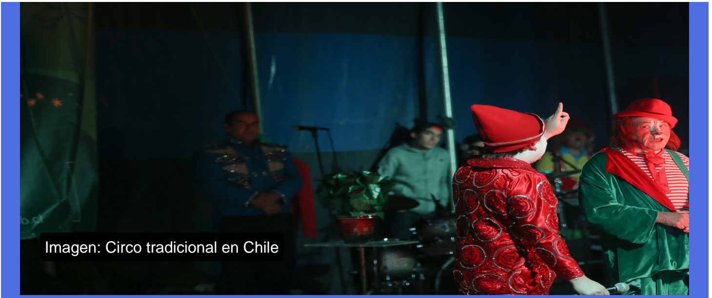
Imagen: Circo tradicional en Chile