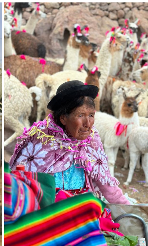
Kimün trarikanmakuñ Wallamapu Técnica de la cuelcha o trenzado. Sistema de ganadería altoandina