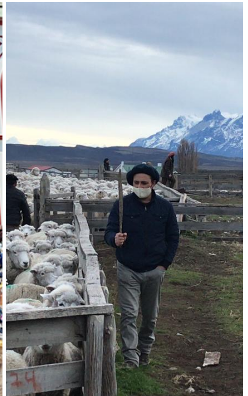
Modo de vida asociado a las labo.