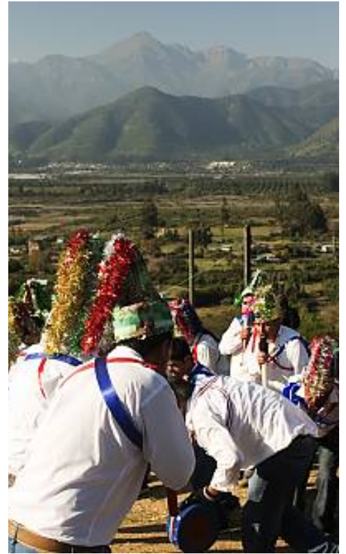
Tejuelería en la región de Aysén Carpintería de ribera en Magallanes Bailes chinos