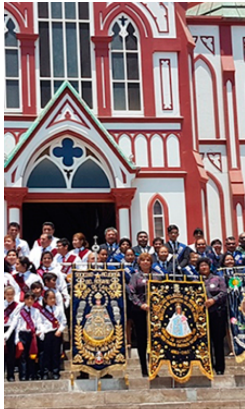
Carpintería de ribera del Boca Let Baile de morenos de paso en la r.