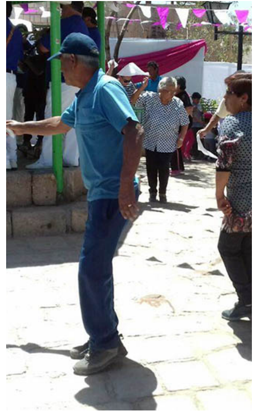
Danza cachimbo de las comunas