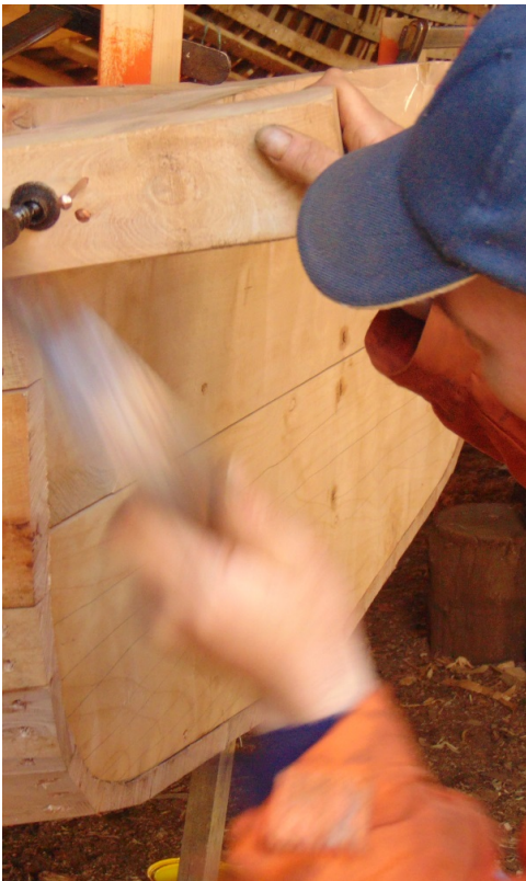
Carpintería de ribera de Cutipay