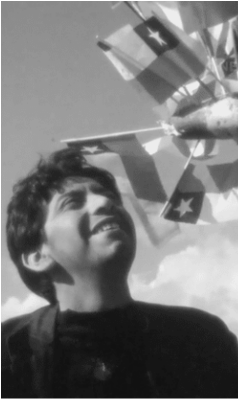
Banderero en fiestas patrias