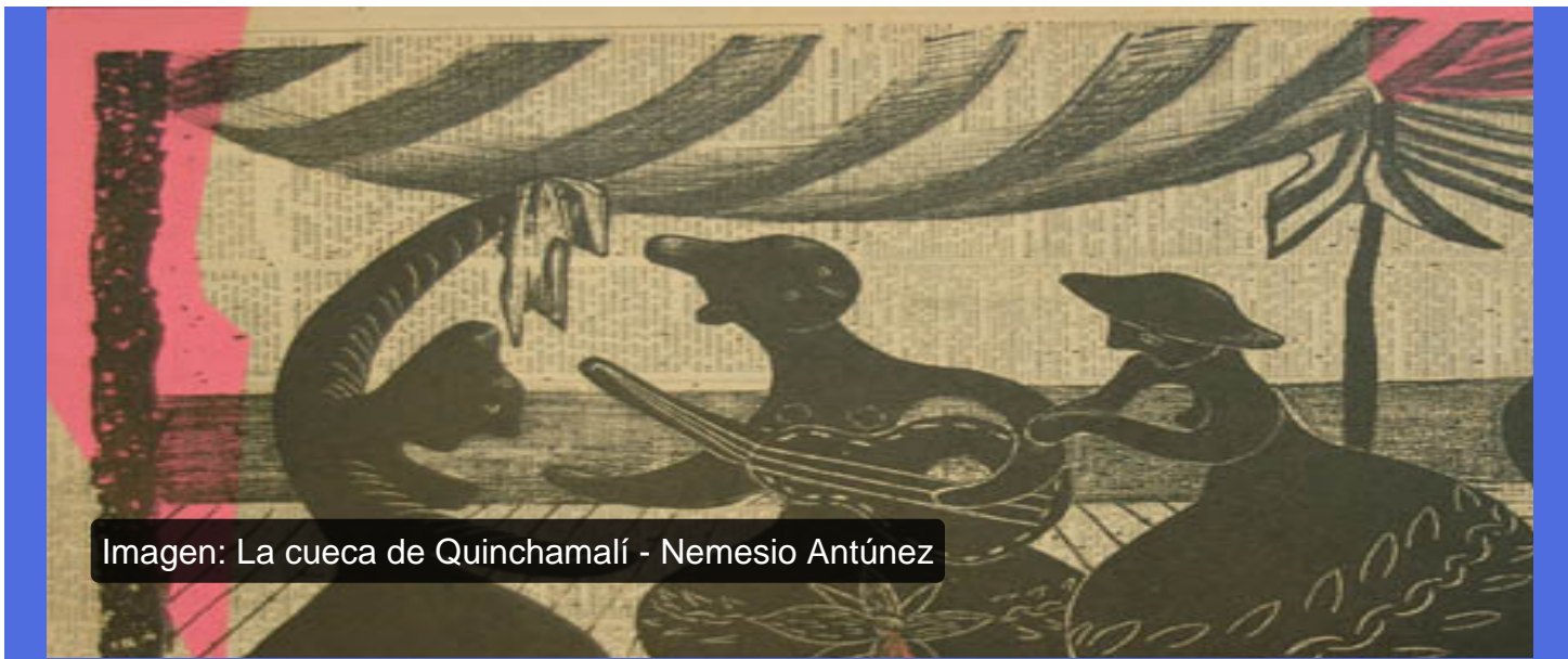
Imagen: La cueca de Quinchamalí - Nemesio Antúnez

El 17 de septiembre de cada año se celebra el Día Nacional de la Cueca, en el marco de las Fiestas Patrias, cuando este baile se luce y recrea a lo largo del territorio nacional. Más allá de esta fecha, la cueca es un patrimonio vivo que encarna la historia y la identidad cultural del país.