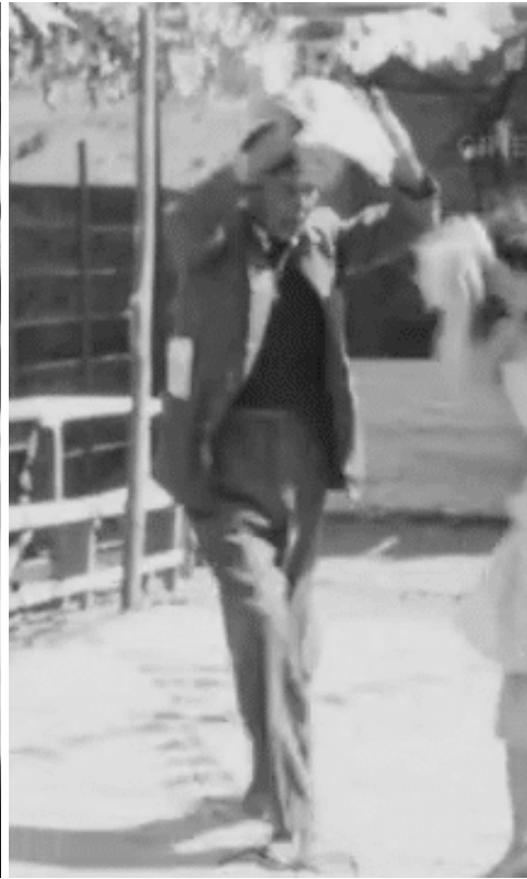
Cuecas de un 18 de septiembre