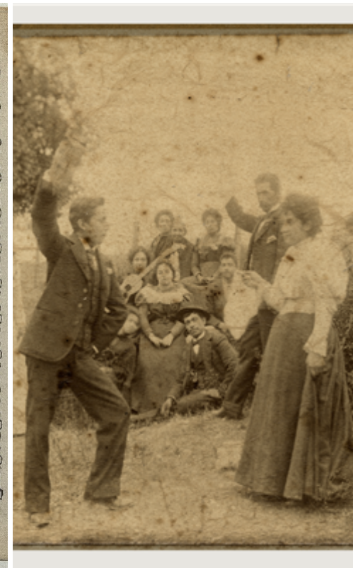
Los Prisioneros cantaron en tributo a Víctor Jara. La aconcaguina cueca para piano Cueca.