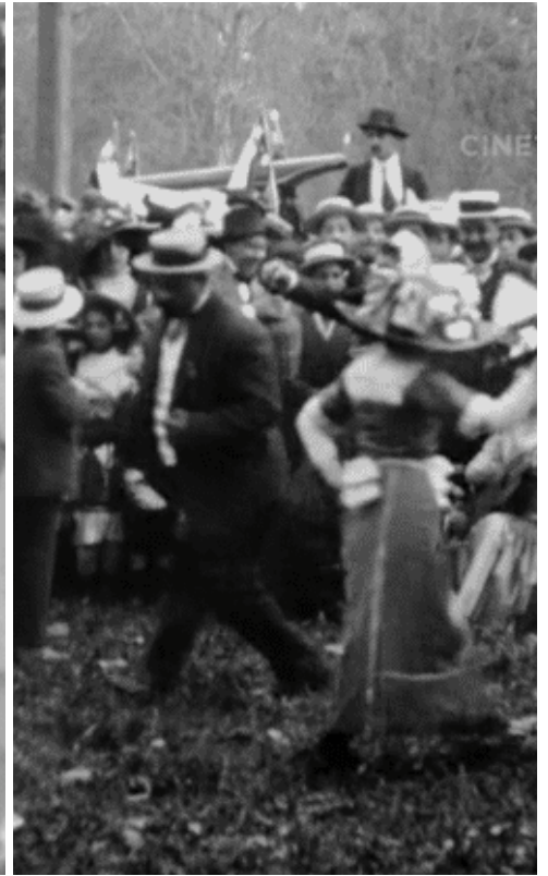
Festejos en el Parque Cousiño