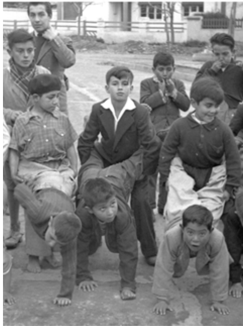
Fiestas Patrias en la Pirámide.