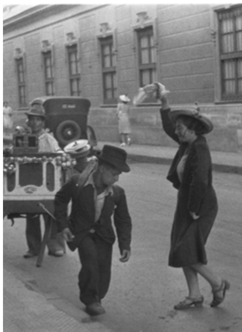
Cueca en el centro de Santiago