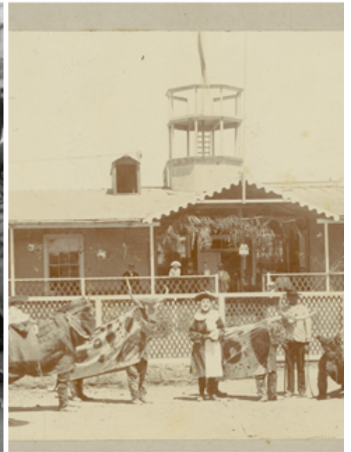
Oficina Salitrera Humberstone