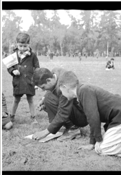
Campeonato de Volantines.