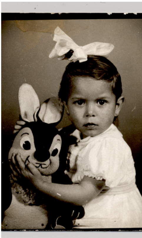
[Niña con una gran cinta blanca ... Niños