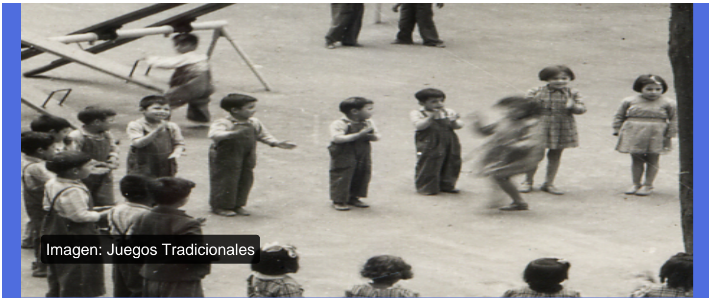
Imagen: Juegos Tradicionales

¿Qué tienen en común un trompo, un volantín y una muñeca de trapo?